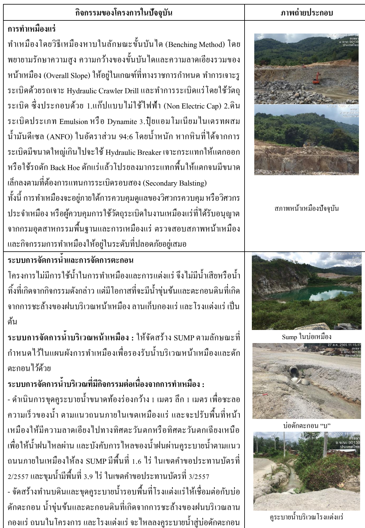
ตารางที่ 1.1 แสดงรายละเอียดของการดำเนินกิจกรรมของโครงการในปัจจุบัน